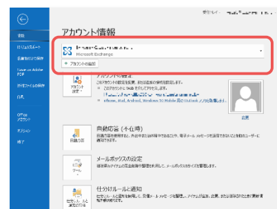
図 2 アカウントの管理 / 追加